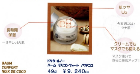
ドクターノ バーム デリコンフォート ノドココ 49g ¥9,240(税)

ココナツ、シアバター、ハニーなど肌に美味しい リッチな成分で、乾燥ぎみの冬の肌を、しっとり、ツヤ肌へ。